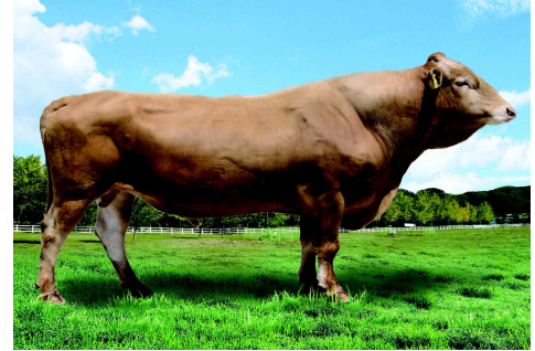
<한우 보증씨수소 케이피엔(KPN)1416>