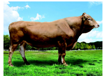
< 케이피엔(KPN)1416 >

KPN1400, KPN1401, KPN1402, KPN1404, KPN1405, KPN1406, KPN1408, KPN1410, KPN1415, KPN1416, KPN1420, KPN1421, KPN1422, KPN1423, KPN1425